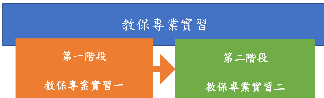
圖一：教保專業實習課程架構

根據上述教保專業實習課程目標，教保專業實習課程分兩階段進行「教保專業實習一」與「教保專業實習二」進行教學，如圖一所示：